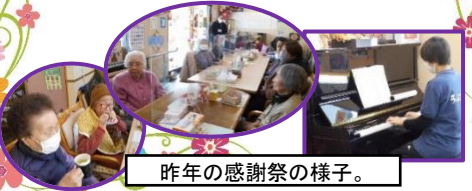
昨年の感謝祭の様子。

今年1年間の感謝をこめて、毎年恒例の感謝祭を行わせていただきます。ささやかな催しではありますが、楽しい憩いの時間をお過ごしください。