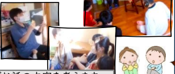
みんなでお話の内容を考えます。